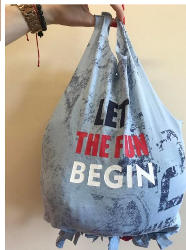
5. Ekotorba gotowa!

4. Powstałe frędzle zwiążuj ze sobą. Zacznij od pierwszego, który zwiążesz z drugim frędzlem, następnie drugi z trzecim itd. W ten sposób stworzysz solidne dno torby.