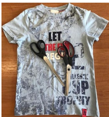
1. Przygotuj starą koszulkę oraz nożyczki.

Każdy z nas może zrobić swoją, niepowtarzalną Ekotorbę na zakupy!