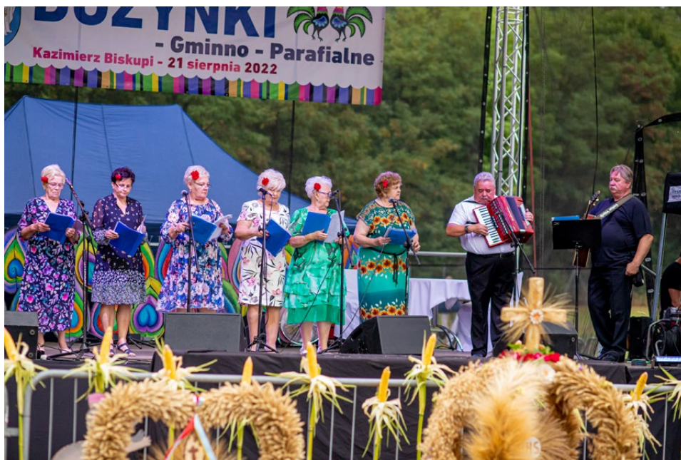
Klub Wesołej Zośki przygotował dożynkowe przyśpiewki

– Spotykamy się tu jako wspólnota, by podziękować za tegoroczne plony i prosić o obfite