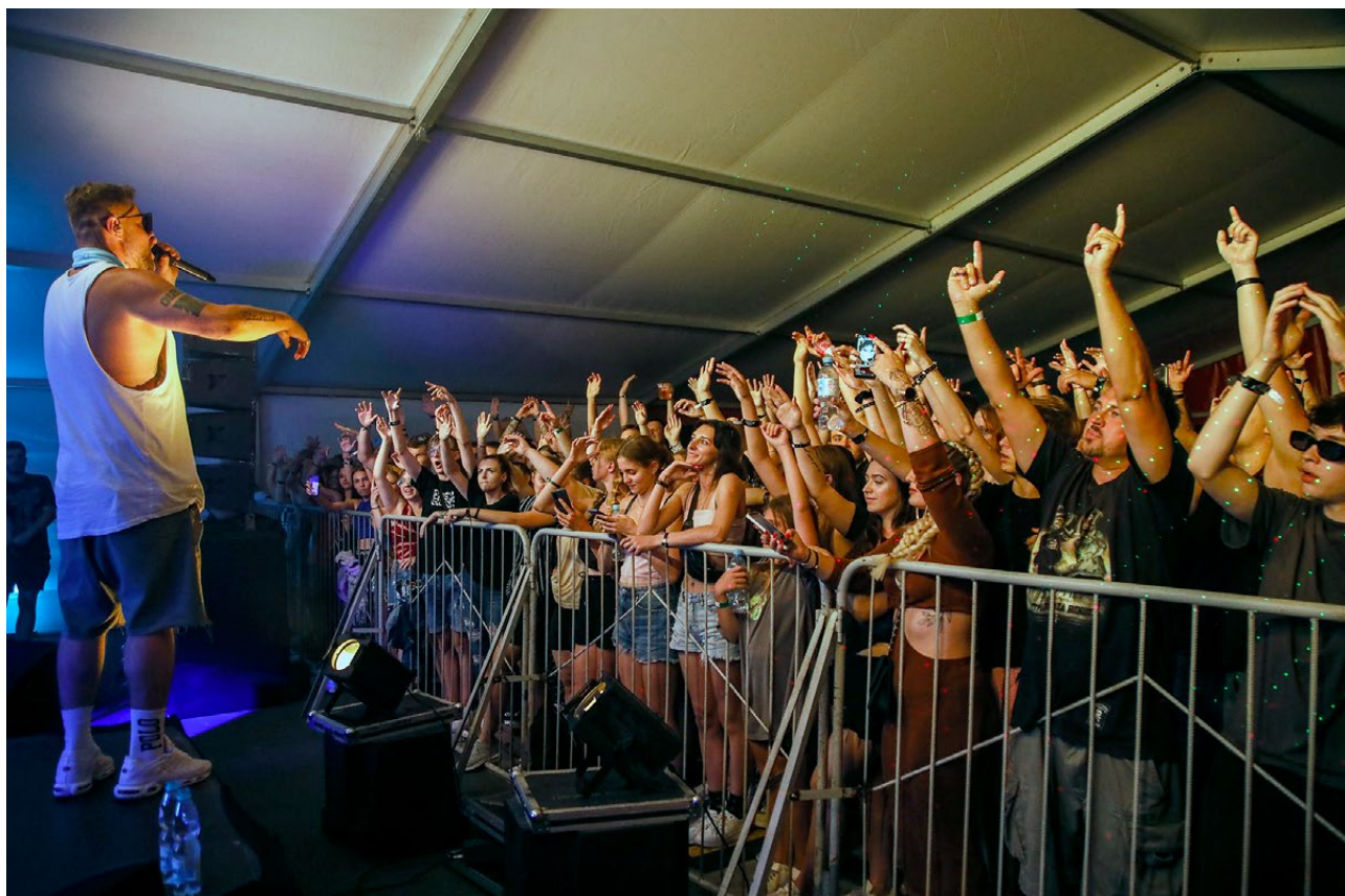
Tede porwał publiczność swoimi hitami