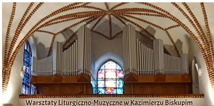
Warsztaty Liturgiczno-Muzyczne w Kazimierzu Biskupim

Zapisy przyjmowane są do 17 września lub do wyczerpania się miejsc na stronie fb – w wydaniu V Warsztaty Liturgiczno – Muzyczne. Ich głównym organizatorem jest Bractwo Świętych Pięciu Męczenników w Kazimierzu Biskupim i Gminny Ośrodek Kultury w Kazimierzu Biskupim. Są także objęte patronatem biskupa włocławskiego i Wyższego Seminarium Duchownego Misjonarzy Świętej Rodziny w Kazimierzu Biskupim oraz władz Gminy Kazimierz Biskupi.