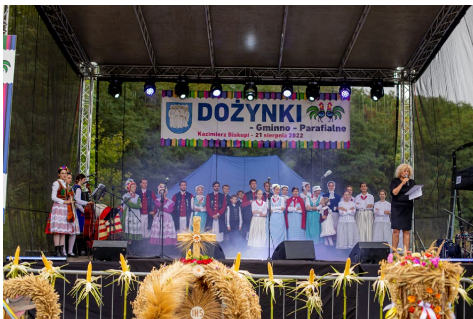
Obrzęd dożynkowy poprowadził zespół „Poligrodzianie”

W trakcie dożynek rozstrzygnięto konkursy. Najpiękniejszy wieniec dożynkowy wykonało Koło Gospodyń Wiejskich z Posady. Drugie miejsce jury przyznało wieńcowi wykonanemu przez KGW Bielawy, a trzecie zajęło sołectwo Wieruszew. Wyróżnienia otrzymały sołectwa Dobrosołowo i Kazimierz Biskupi. Natomiast w konkursie na