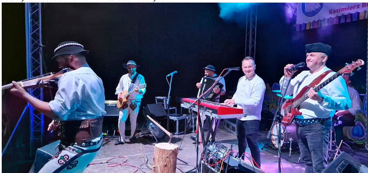
Publiczność rozgrzał zespół „Baciary”

Dziękujemy również LGD „Między ludźmi i jeziorami” za ufundowanie bonów w konkursach.